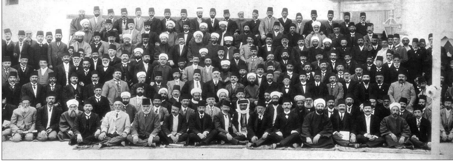
1908'de Meclis'in açılışında Meclis önünde mebuslar.