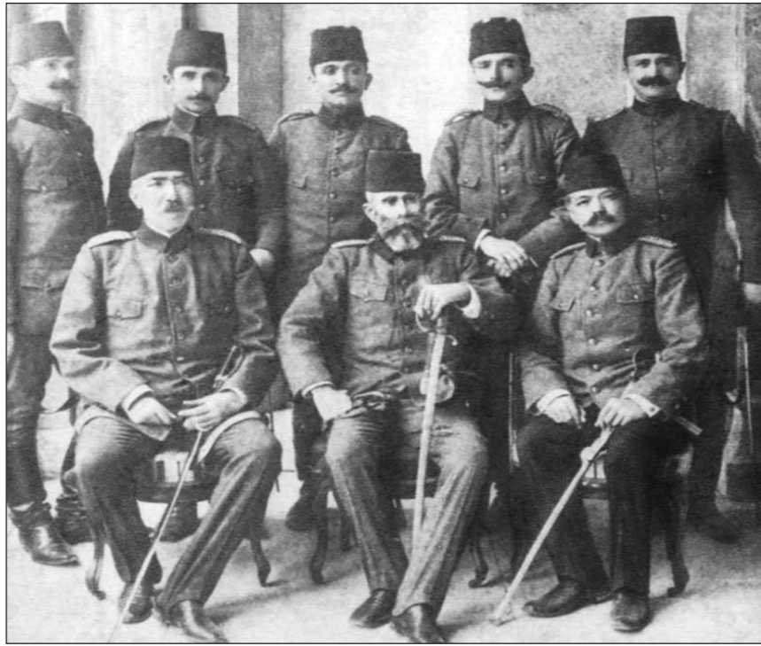
Mahmut Şevket Paşa komutasında, aralarında İsmet İnönü'nün (arka solda ikinci) de bulunduğu Hareket Ordusu lider kadrosu.

Bu kargaşa sırasında, Osmanlı Mebusan Meclisi üyeleri İstanbul'dan Yeşilköy'e kaçmışlardı. Orada bulunan Meclis üyeleri ile Meclis-i Milli adıyla toplanıp ayaklanmayı kıskırttığı için Padişah Abdülhamit'in tahttan indirilmesine karar verdiler. (23 Nisan 1909)