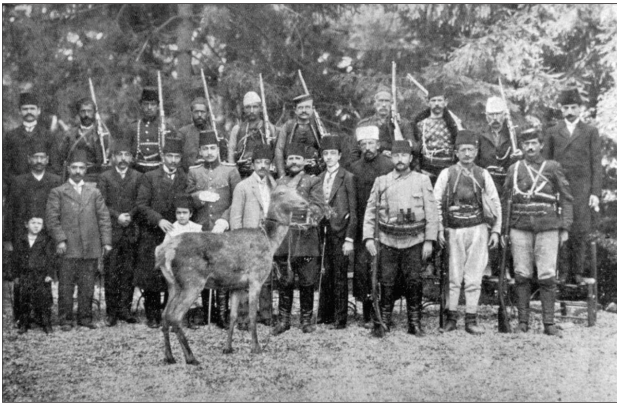
Çetesiyile dağa çıkarak Kanun-i Esasi'nin yürürlüğe konulmasını isteyen Resneli Niyazi Bey (önde soldan 7.) ve ünlü geyiği.

Sözü burada yabancı bilim adamlarına bırakıyoruz.