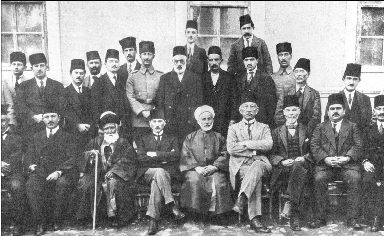
Sivas Kongresi'ne katılan üyelerin bir bölümü Kongre başkanı Mustafa Kemal ile kongrenin toplandığı binanın önünde görülmüşler.

4 Eylül 1919 günü, Sivas halkı saat 13'ten itibaren Sivas Lisesi'ne giden yolları doldurmuştu. Çünkü kongre saat 14.00'te başlayacaktı. Burada sözü yine Mazhar Müfit'e