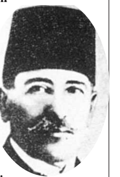
İsmail Fazıl Paşa

Refet Bey'in bu sorusu önergeyi verenler üzerinde bir çok etkisi yapmış olacak ki, İsmail Fazıl Paşa yerinden bağırdı. "Muhtırayı üçümüz geri alıyoruz. Çünkü sui tefehülümü mücip oluyor (yanlış anlamaya neden oluyor)" dedi. Bu üç kişi, mandayı savunan İsmail Fazıl Paşa, Bekir Sami Bey ve İsmail Hami Bey'di. Bu ilginç durum, bir olanak yaratıyordu. Başkan Mustafa Kemal, "Muhtıra istirdat olunmuştur (geri alınmıştır)" dedi. Ancak muhtıranın sahipleri, önergelemleri geriye çektiler halde, Refet Bele Bey kürsüden inmedi ve konuşmasını bir saat daha sürdürdü.